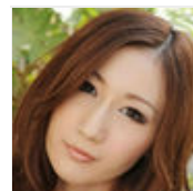
10种最适合冬季吃的蔬菜